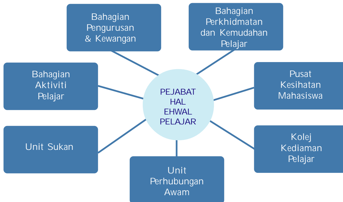
Carta Organisasi Pejabat Hal Ehwal Pelajar

Pejabat Hal Ehwal Pelajar di Universiti Teknologi Malaysia, boleh dibahagikan kepada beberapa Bahagian/Unit seperti berikut: